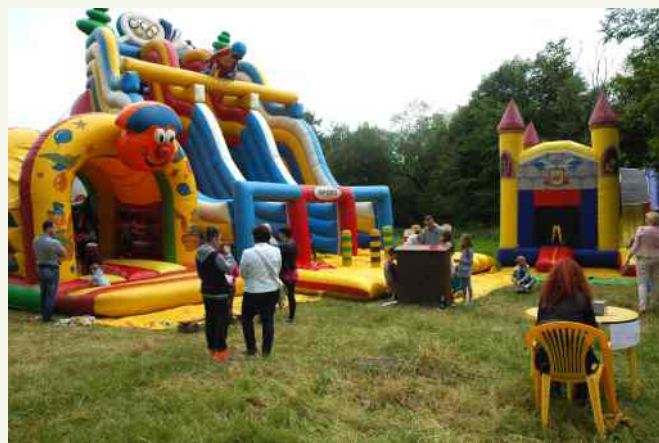
Najmłodszy uczestnicy rodzinnej biesiady mogli do woli korzystać z zjeżdżalni, sprawdzić siły na trampolinie oraz zająć stodycze.