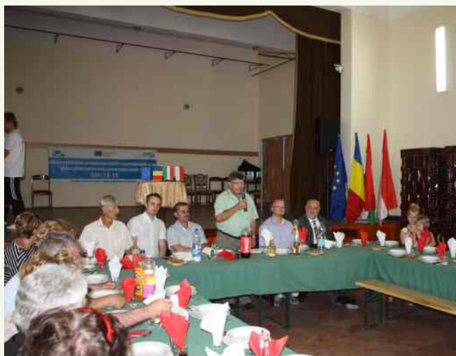
↑ Podczas wizyty nie zabrakło również spotkań integracyjnych w czasie których dyskutowano na różne tematy dotyczące życia społecznego, gospodarczego i ekonomicznego. ↑