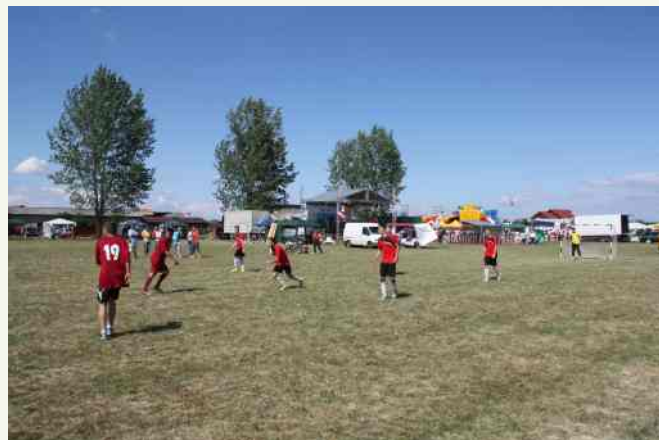
W pierwszym dniu pobytu reprezentanci Klubu Sportowego "Sokół" Słopnice wzięli udział w międzynarodowych rozgrywkach sportowych. ↑