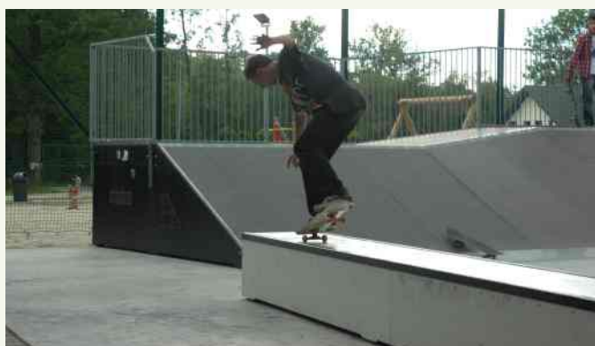
← Niedzielną impreza przyciągnęła do Słopnic wielu mieszkańców, a także gości z sąsiednich gmin.

W ramach imprezy Muzyczne Lato 2014 w skateparku w Słopnicach odbyły się zawody deskorolkowe o Puchar Wójta Gminy Słopnice. Zawodnicy wykazali się znakomitymi umiejętnościami i sprawnością fizyczną. Triki wykonane na desce dostarczyły widzom wiele emocji.