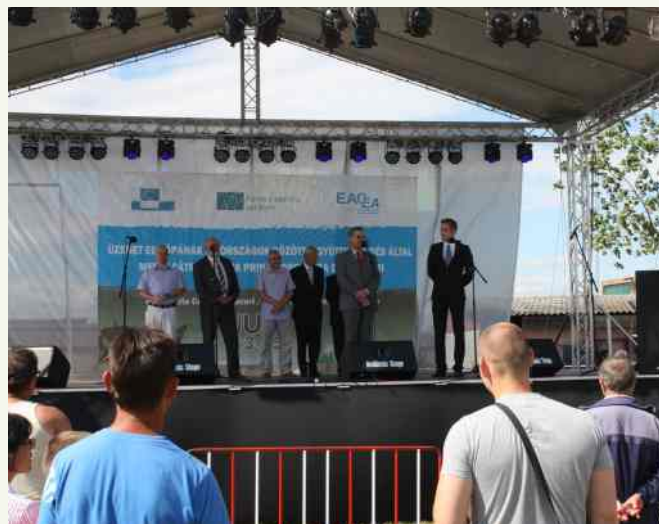
Przedstawiciele Gminy Słopnice mieli okazję uczestniczyć w święcie miasta. ↑