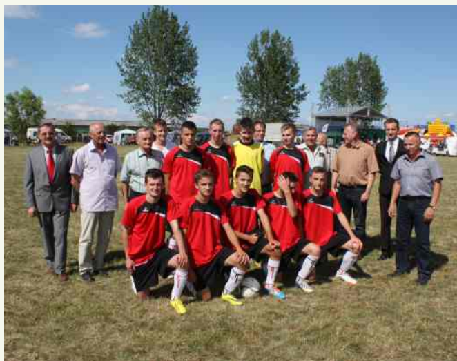
↑ Mecze rozegrane pomiędzy ośmioma drużynami zakończyły się zwycięstwem naszych sportowców.