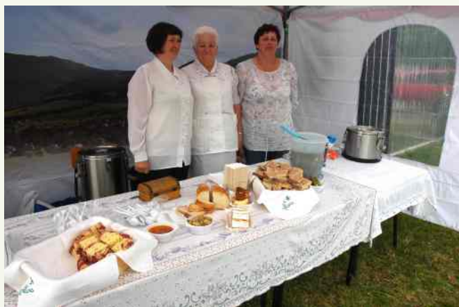
↑ Uczestnicy podczas imprezy mogli skosztować różnego rodzaju potrawy regionalne przygotowane specjalnie na niedzielną imprezę przez Panie z Koła Gospodyń Wiejskich ze Słopnic.