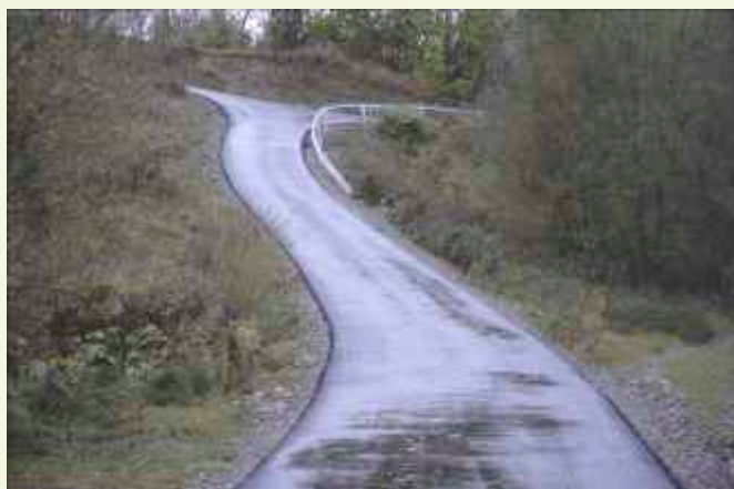
↑ Nowa nawierzchnia asfaltowa i bariery ochronne na drodze Czeczotki