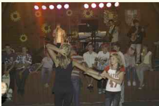
↑ W wir tańca i dobrej zabawy wciągnął wszystkich rodzimy zespół „Rewers”