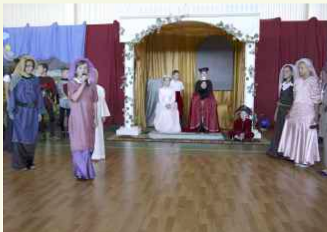
Widzowie mieli również okazję przenieść się ↑ do czasów panowania Króla Kazimierza Wielkiego.