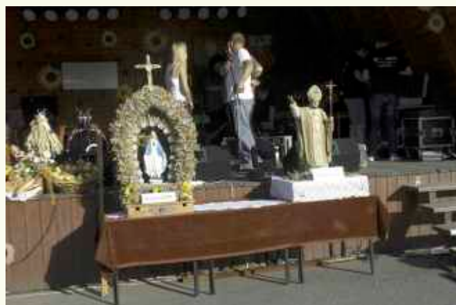
↑ Piękne wieńce dożynkowe wykonane zostały przez mieszkańców z osiedli: Jachymówka, Ślęzykówka, Trzajnowka, Dworskie, Nad Sadem i Przylaski ze Słopic Dolnych i mieszkańców osiedli: Cołtyrz, Mordaszkie, Goryczki i Śliwówka ze Słopic Górnych

Serdecznie dziękujemy wszystkim mieszkańcom za udział w tegorocznych uroczystościach dożynkowych oraz wszystkim, którzy przyczynili się do uświetnienia tego wydarzenia.