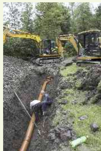
Prace kanalizacyjne ↑ w osiedlu Markówka

Sprzyjające warunki atmosferyczne spowodowały oszczędności w wydatkowaniu środków na zimowe utrzymanie dróg, ze środków tych realizowane są jeszcze obecnie kolejne ważne zadania.