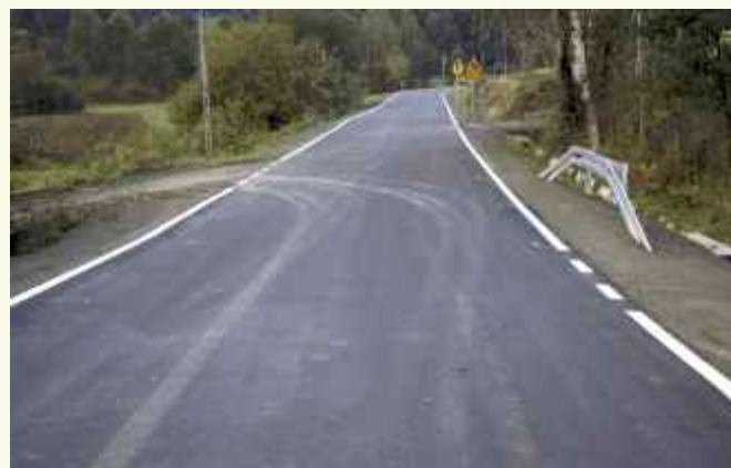
Droga Słopnice - Chyszówki w kierunku Zaściercza ↑