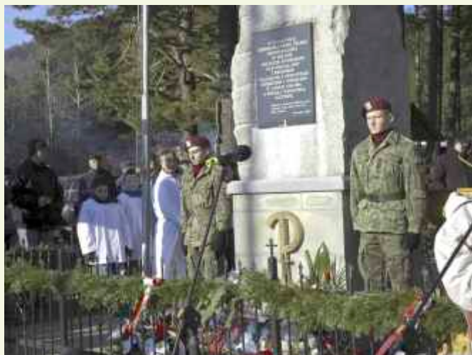
↑ Szczególnego nastroju uroczystości dodał apel poległych, którego kanwą były historyczne wydarzenia związane z odzyskaniem niepodległości oraz honorowa warta przy pomniku, pełniona przez uczniów szkoły wojskowej Zespołu Szkół im. KEN z Tymbarku