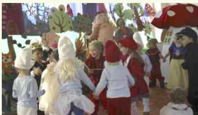
↑ W krainę baśni uczestników akademii wprowadziły małe smerfy z przedszkola w Słopicach Dolnych.