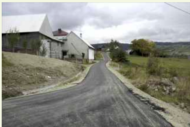
Droga asfaltowa w osiedlu Folwark ↑