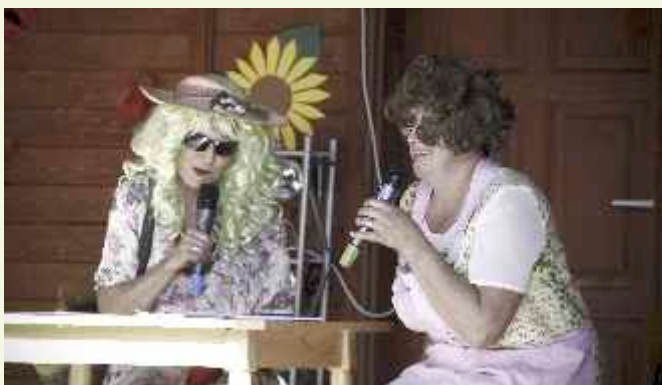
↑ Było i „Spotkanie po latach”, w przedstawieniu naszych aktorek z Koła Gospodyń Wiejskich