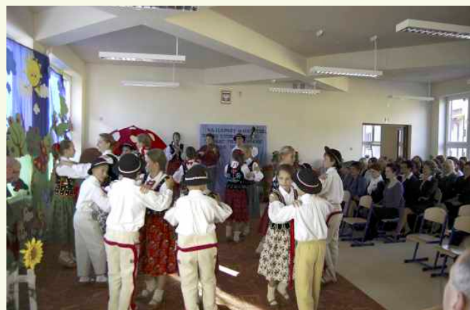
„Mali Słopiczanie” wykonali góralski taniec i zaśpiewali piosenki, których melodia rozbrzmiewała na całą szkołę ↑