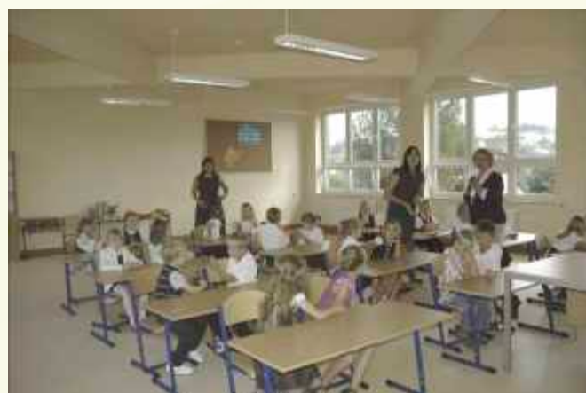
Jako pierwsi mieli okazję zasiąść w ławkach nowej klasy ↑