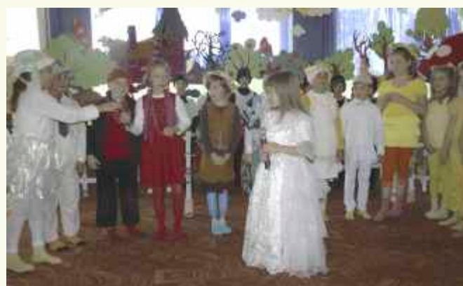
Popis swoich umiejętności teatralnych ↑ zaprezentowali również uczniowie klas od I-III w spektaklu pn. „Brzydkie kaczątko”