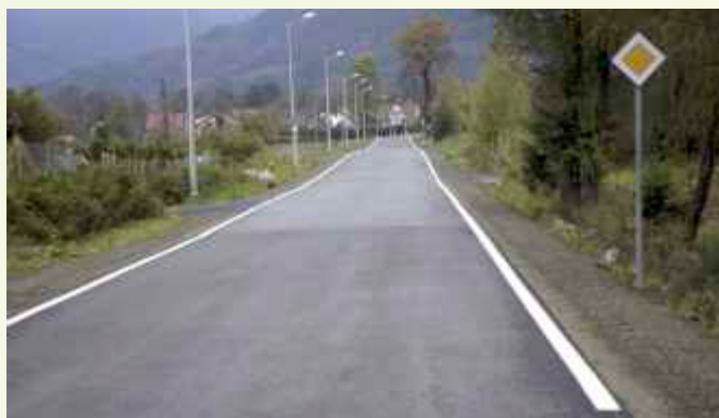
↑ Oświetlenie drogowe w kierunku Zamieścia