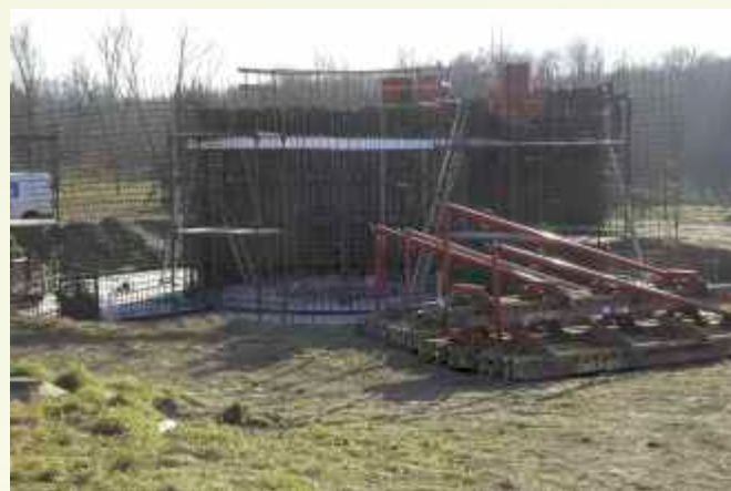
Oczyszczalnia ścieków przybiera już swoje ↑ projektowe kształty

Na realizację inwestycji pozyskano środki finansowe: