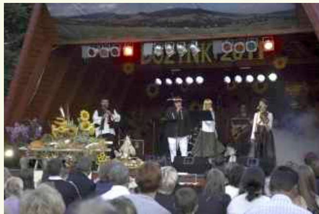
Na góralską nutę zagrał zespół „Dukat” z serca żywiecczyny czyli Żywca ↑