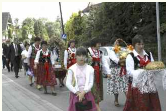
Święto rolników rozpoczęło się uroczystym ↑ przemarszem na dziękczynną mszę św. do kościoła pw. św. Andrzeja Apostoła w Słopnicach Dolnych