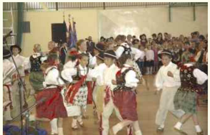
Część artystyczną rozpoczął występ góralskiego zespołu „Mali Słopniczanie” ↑