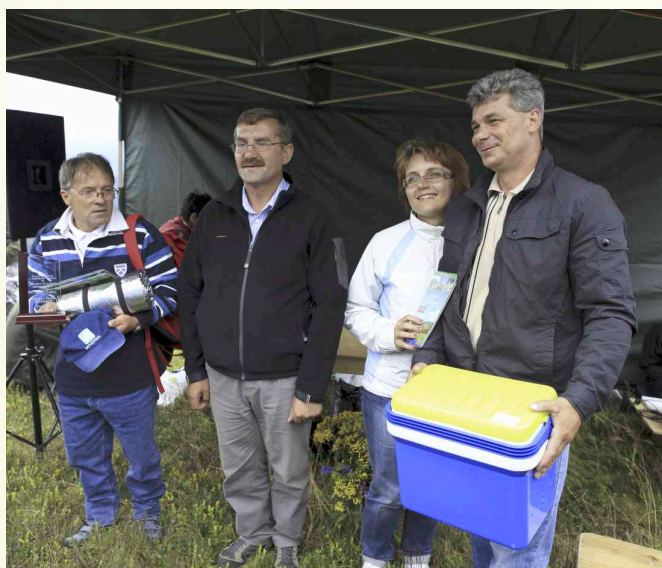
↑ Największą odległość by zdobyć szczyt Mogielicy pokonali turyści z Brodnicy koło Torunia, a jeszcze dłuższą wędrowcy z samej Brukseli.

Na zakończenie tegorocznego spotkania na Mogielicy Wójt Gminy Słopnice złożył gratulacje i wręczył upominek trzydziestoosobowej grupie „Ćwiesiówka” z Dobrej, którzy rodzinie przemierzają szlaki uczestnicząc we wszystkich tegorocznych wędrowkach programu „Odkryj Beskid Wyspowy”.