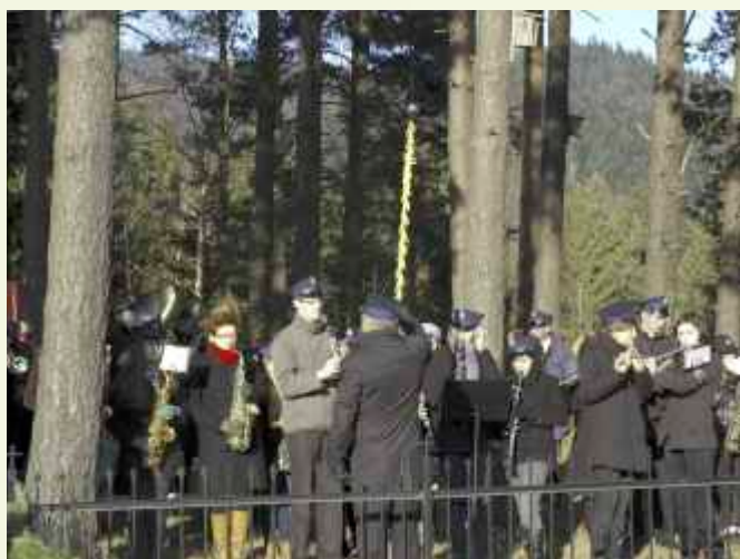
↑ Obchody upamiętniające wydarzenia 1918 r. rozpoczęły się koncertem melodii patriotycznych w wykonaniu orkiestr dętych ze Słopnic i Dobrej