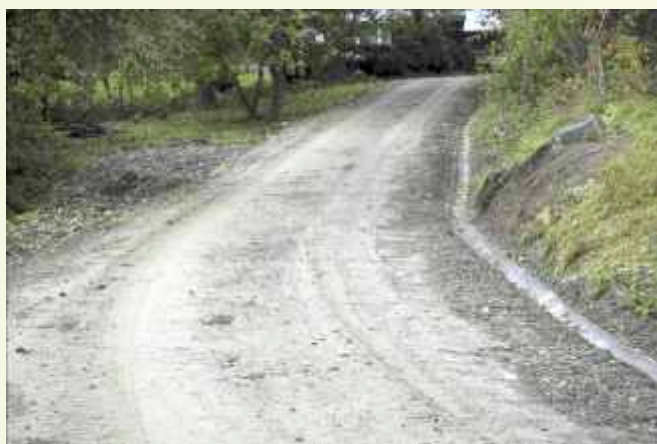
Droga Banachy w Górnych Słopnicach ↑ tuż po remoncie

W ramach inwestycji drogowych został także wykonany przepust skrzynkowy w ciągu drogi gminnej Słopnice-Mogielica, za kwotę 61 767 zł . Zakupiono i zamontowano dwie nowe wiaty przystankowe w Słopnicach Górnych, które kosztowały 8 364 zł .