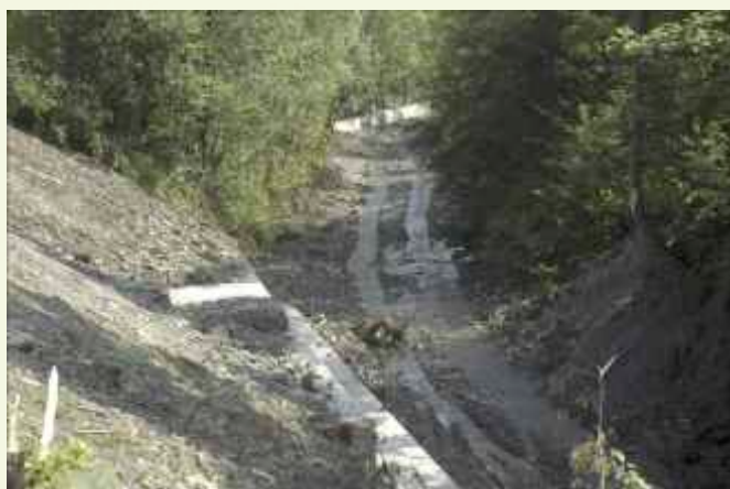
↑ Zabezpieczenie przy drodze gminnej Słopnice-Mogielica