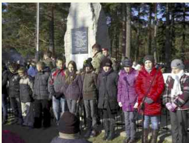
↑ Uczniowie Gimnazjum Publicznego w Jurkowie recytowali patriotyczne wiersze i nucili znane żołnierskie melodie