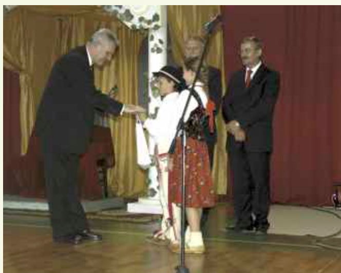
↑ W podziękowaniu za owocną współpracę, uczniowie wręczyli Aleksandrowi Palczewskiemu - Małopolskiemu Kuratorowi Oświaty pamiątkową statuetkę