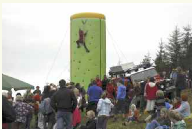
↑ W czasie kiedy jednych pochłaniał konkurs piękności, inni główkowali nad quizem o Beskidzie Wyspowym, a najmłodszy próbowali swoich sił na ścianie wspinaczkowej