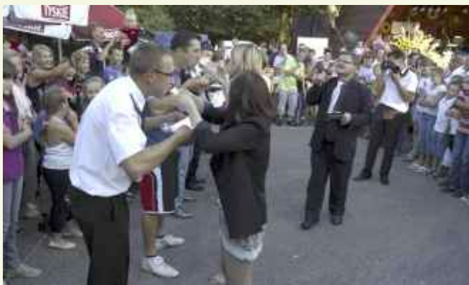
↑ Mnóstwo zabawy i dobrego humoru dostarczyły wszystkim konkurencje rozegrane pomiędzy sołectwami