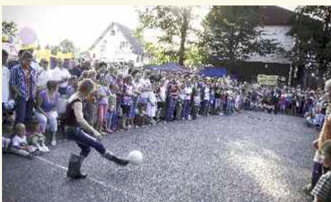
↑ ...nawet kobiety udowodniły, że wspaniale potrafią kopać piłkę...