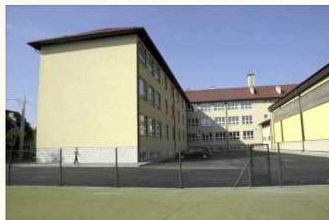
Nowo dobudowana część Zespołu Placówek Oświatowych w Słopnicach ↑

We wrześniu oddano do użytku nowo dobudowane skrzydło Zespołu Placówek Oświatowych w Słopnicach wraz z wyremontowaną starszą częścią budynku.