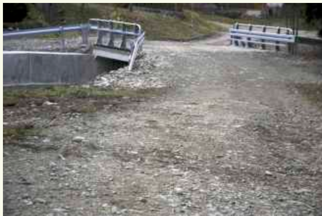
Przepust w osiedlu Wróble Podmogielicą ↑

Gmina Słopnice włączyła się również finansowo w przebudowę dróg powiatowych na odcinku