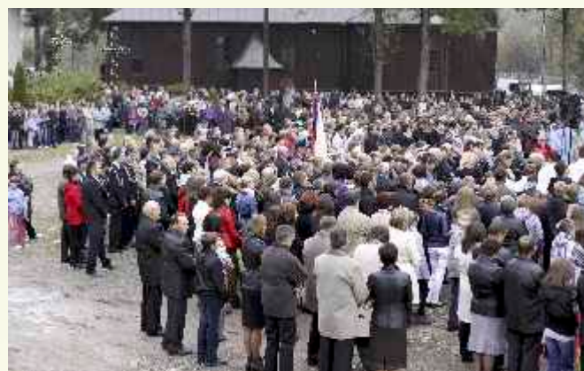
↑ Najliczniej na uroczystość przybyli mieszkańcy Słopnic. ↑