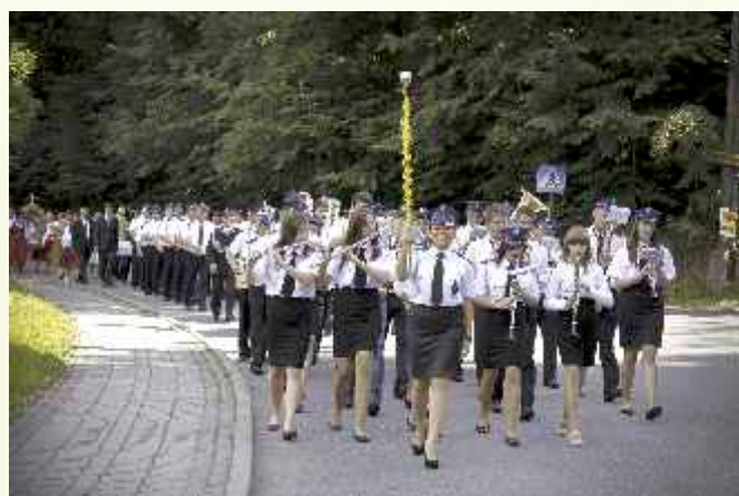
↑ Pochodowi dowodziła Orkiestra Dęta „Wiolin” oraz jednostki Ochotniczych Straży Pożarnych ze Słopnic

Zapraszamy do obejrzenia fotoreportażu z uroczystości: