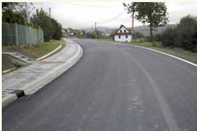
↑ Chodnik w kierunku Zaświercze w osiedlu Plebańskie

Słopnice-Chyszówki w zakresie budowy chodnika w osiedlu „Plebańskie” oraz oświetlenia ulicznego w osiedlach „Folwark” i „Zapotocze” przekazując na realizację zadania 292 000 zł . Inwestycja ta była realizowana przez Powiat Limanowski z udziałem środków Narodowego Programu Przebudowy Dróg Lokalnych.