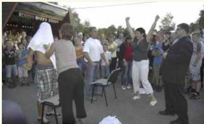
Górowały emocje i zacięta rywalizacja