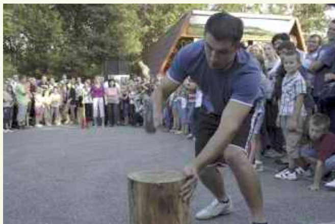
...i młotek też poszedł w ruch