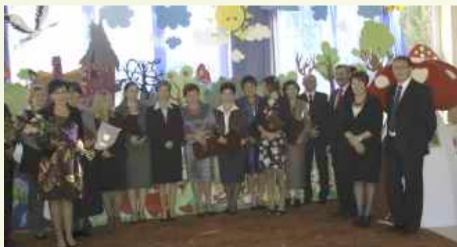
↑ Nagrodę wójta za pracę z laureatami i finalistami konkursów przedmiotowych otrzymało 14 nauczycieli