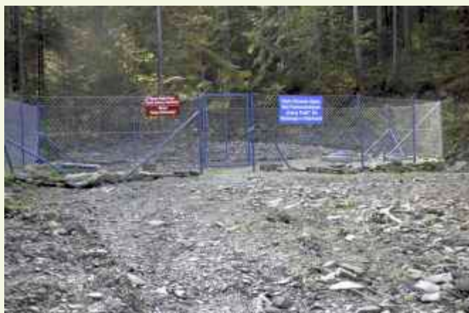
↑ Ujęcie wody w Zaświerczu

W bieżącym roku wybudowano ujęcie wody w Zaświerczu, zbiorniki wyrównawcze w osiedlu Podgórze oraz sieć łączącą zbiorniki wyrównawcze z istniejącą siecią wodociągową, za kwotę 590 000 zł.