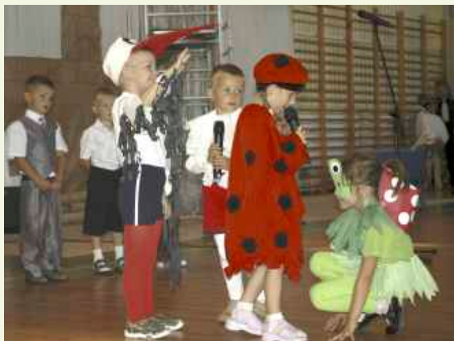
↑ Serca gości i pozostałych osób podbiły przedszkolaki, które także przygotowały specjalny występ z okazji święta ich szkoły