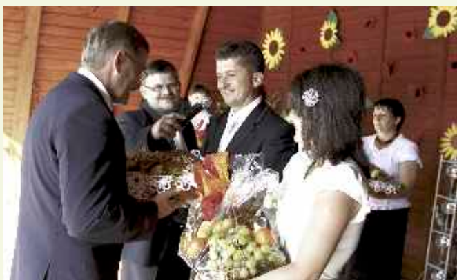
↑ Gospodarze dożynek przekazali chleb dożynkowy wódcarzom gminy i powiatu. Ten symboliczny moment rozpoczyna święto zbiorów