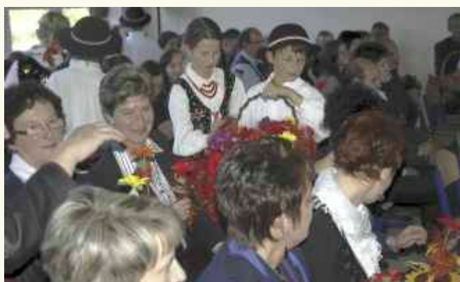
↑ Uczniowie w podziękowaniu wręczyli wszystkim pracownikom oświaty oraz zaproszonym gościom wykonane przez siebie kwiaty