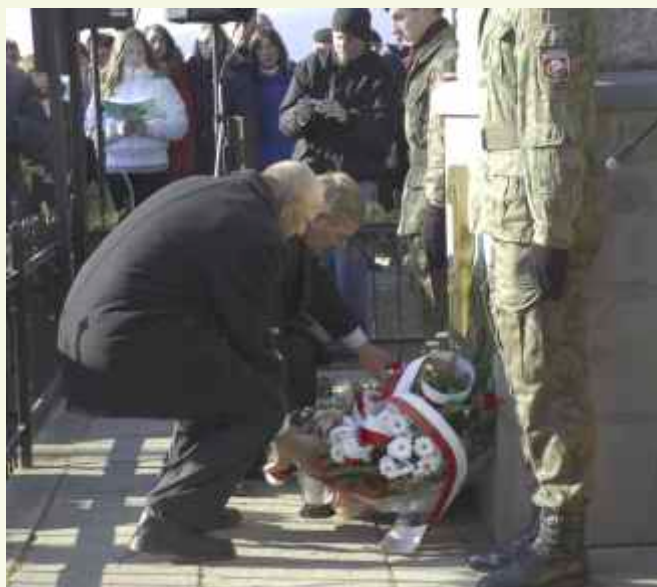
Wieniec i znicze złożyły delegacje samorządów, uczniów i innych organizacji