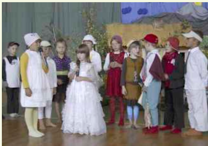
↑ Popis dali także starsi uczniowie w przedstawieniu pn. "Brzydkie kaczątko"