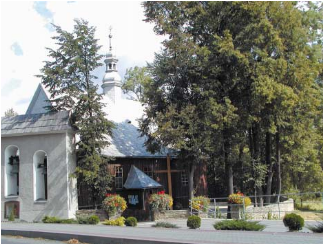
Kościół parafialny pod wezwaniem św. Andrzeja Apostoła