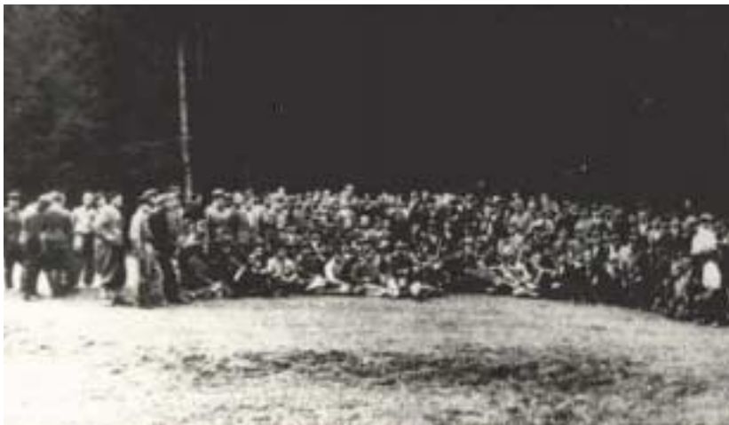
Oddziały partyzanckie stacjonujące na Mogielicy

Administracyjna przynależność Słopnic wielokrotnie podlegała zmianie, ostatecznie 1 stycznia 1997 r. po odłączeniu się od Gminy Tymbark, utworzono Gminę Słopnice.