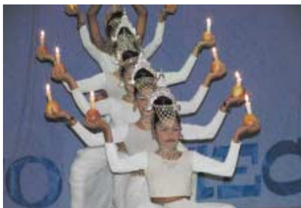
Występ zespołu Ranga Kala ze Sri Lanki