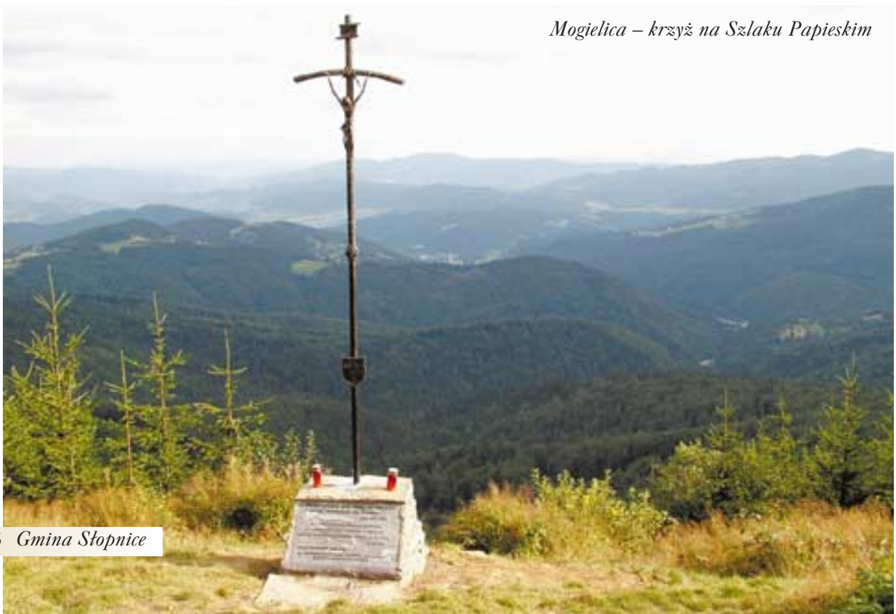
Mogielica – krzyż na Szlaku Papieskim

Teren wyniesiony jest od około 400 do 1171 m n.p.m. Ze względu na różną wysokość n.p.m. można obserwować wydzielanie się pięter klimatycznych i roślinnych.