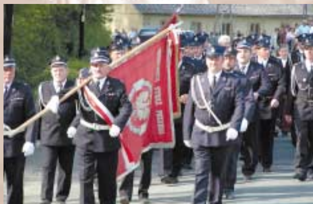
Ochotnicza Straż Pożarna