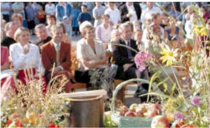
Publiczność zgromadzona przy amfiteatrze