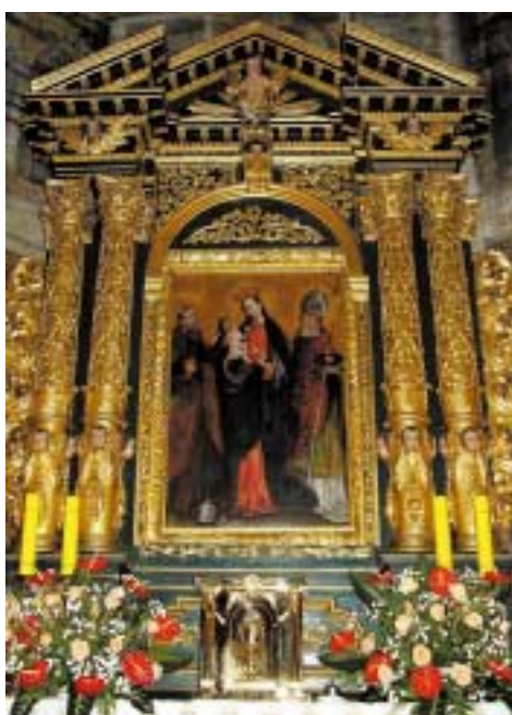
Ołtarz główny w kościele św. Andrzeja