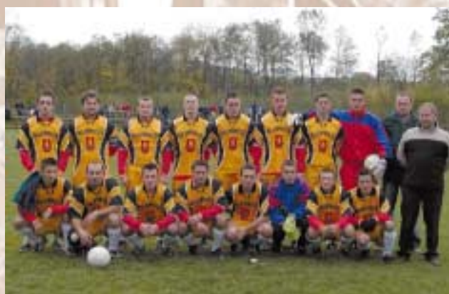
Drużyna piłkarska KS „Sokół”