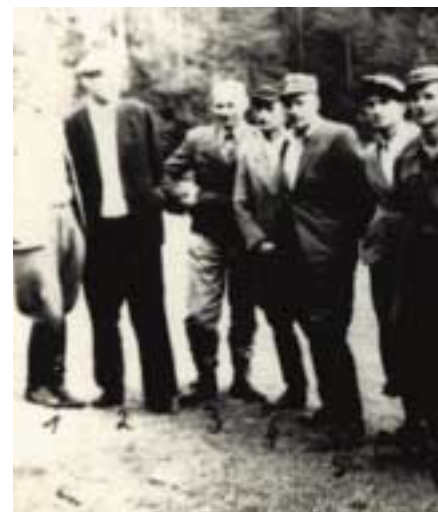
Dowódcy oddziałów partyzanckich