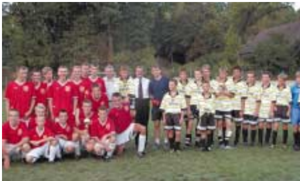
Reprezentacje piłkarskie młodzieży Chlebnic i Słopnic

Gmina Słopnice kontynuuje zapoczątkowaną w 2002 roku, ożywioną współpracę z gminą Chlebnice na Słowacji. Kontakty obu miejscowości zaowocowały wieloma spotkaniami.