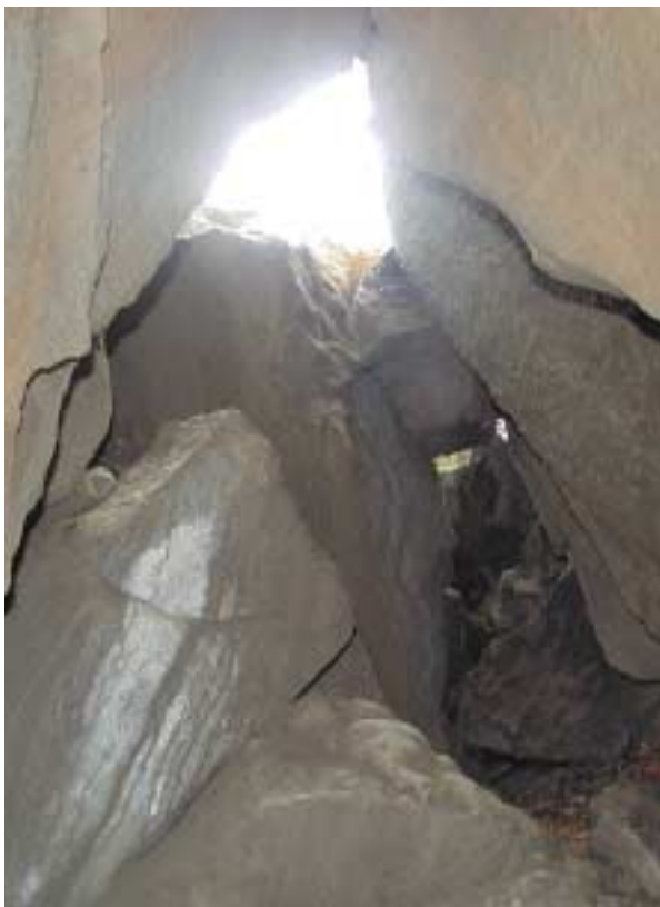
Jaskinia Zbójcecka na Łopieniu