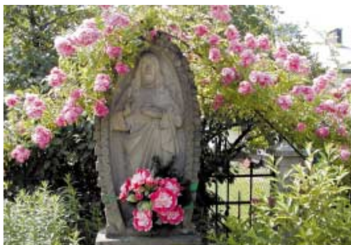
Kapliczka przydrożna na osiedlu Markówka