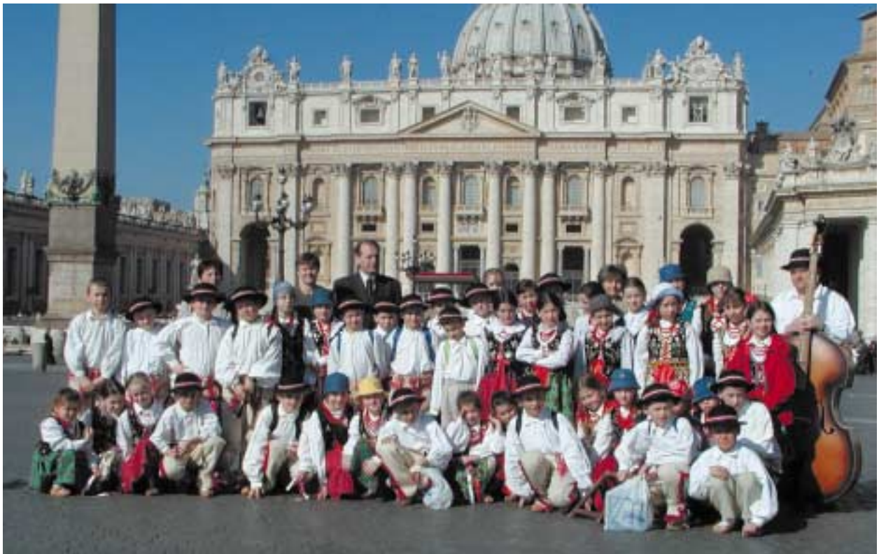
Zespół Dziecięcy „Mali Słopniczanie” w Watykanie

Dzieci i młodzież ze Szkoły Podstawowej nr 1 w Słopnicach występują w zespole „Mali Słopniczanie”. Założony w 1999 roku zespół liczący 53 członków prężnie działa, występując na scenach w kraju i za granicą, dając niezapomniane przeżycia związane z góralszczyzną. Bierze udział w przeglądach, konkursach wojewódzkich i ogólnopolskich, zdobywając liczne nagrody i wyróżnienia. Gościnnie występuje na imprezach kulturalnych, wystawach, wernisażach i pokazach.