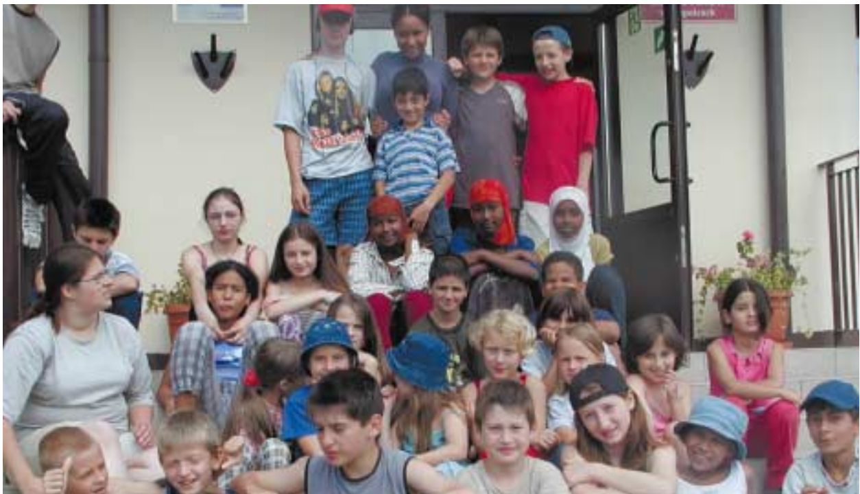
Młodzież z Somalii, Bośni i Czeczenii podczas pobytu w Słopnicach