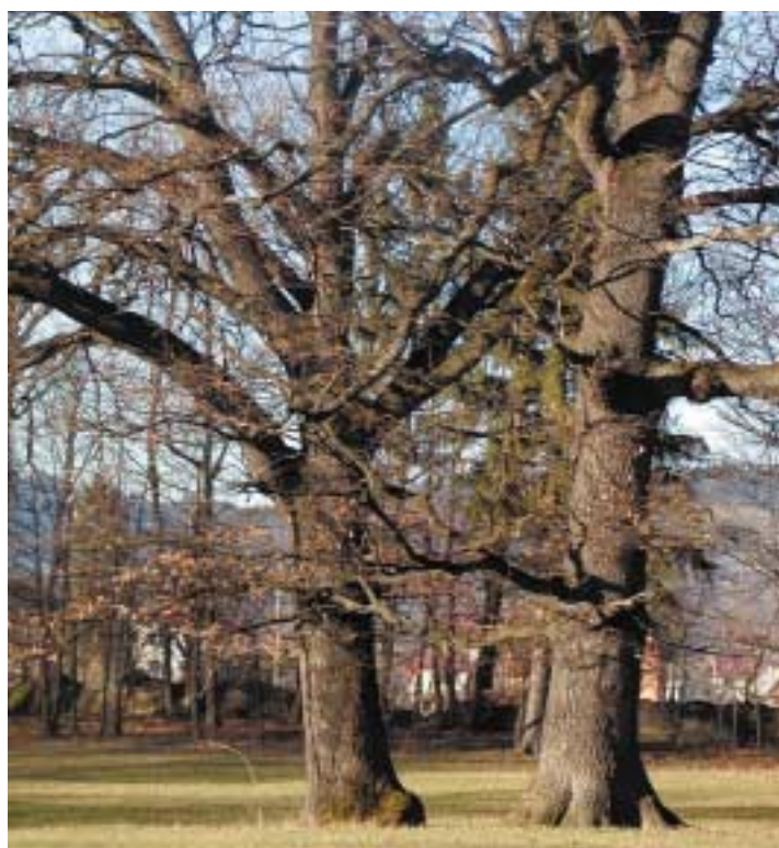
Wielowiekowe dęby w parku przy dworze