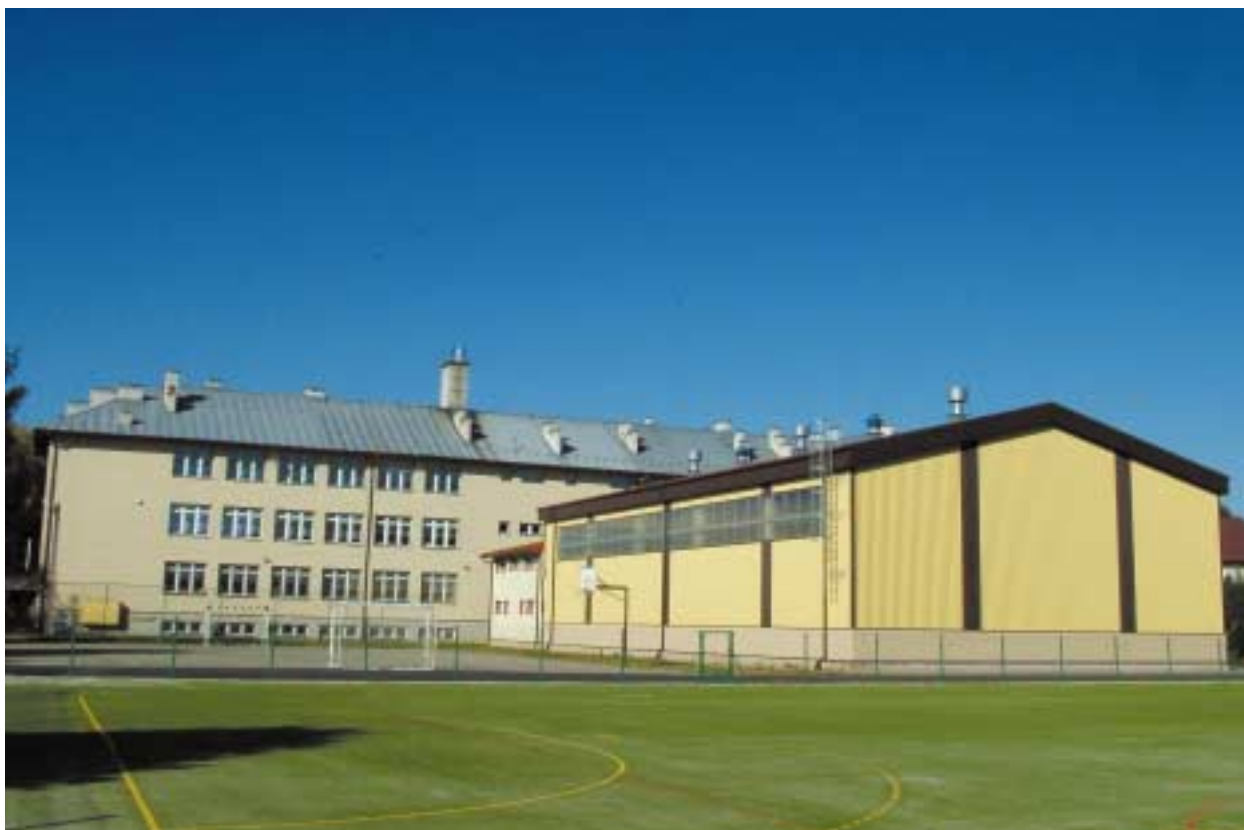
Kompleks sportowy przy Gimnazjum i Szkole Podstawowej Nr 1