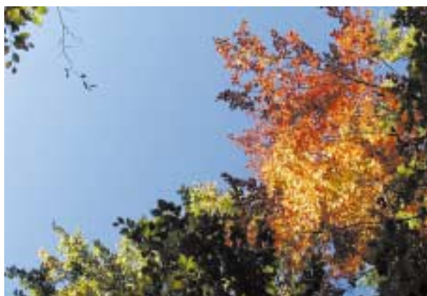
Lasy porą jesienną