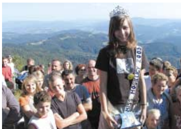
Wybory Miss Mogielicy

Głównym celem wędrowek turystów jest Mogielica (1171 m n.p.m.) – Królowa Beskidu Wyspowego. Ze szczytu Mogielicy można podziwiać piękną panoramę Tatr, Gorców, Pienin i całego Beskidu Wyspowego. Pod względem widokowym rozległa hala na zachodnim stoku Mogielicy jest jednym z najbardziej oryginalnych miejsc w Beskidzie Wyspowym. Mogielica stanowi również doskonały punkt wypadowy na inne sąsiadujące szczyty: Krzysztonów, Jasień, Przysłop, Turbacz (1310 m n.p.m.). Corocznie w przedostatnią niedzielę sierpnia na szczycie Mogielicy odbywa się Złaz Turystyczny, który jest jedną z największych imprez turystycznych organizowanych w powiecie limnowskim. Zabawa połączona z biesiadą i konkursami stanowi atrakcyjną ofertę spędzenia wolnego czasu w górach.