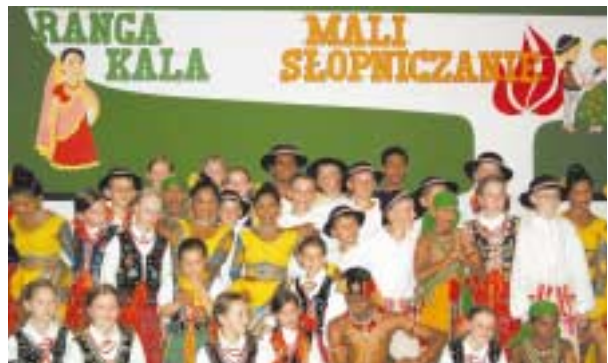
„Mali Słopniczanie” z przyjaciółmi ze Sri Lanki