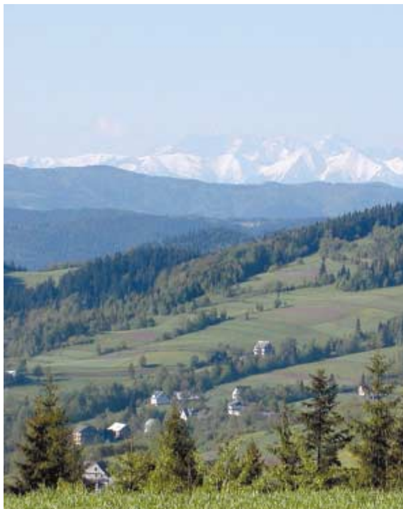
Widok z Przełęczy Słupnickiej na Tatry