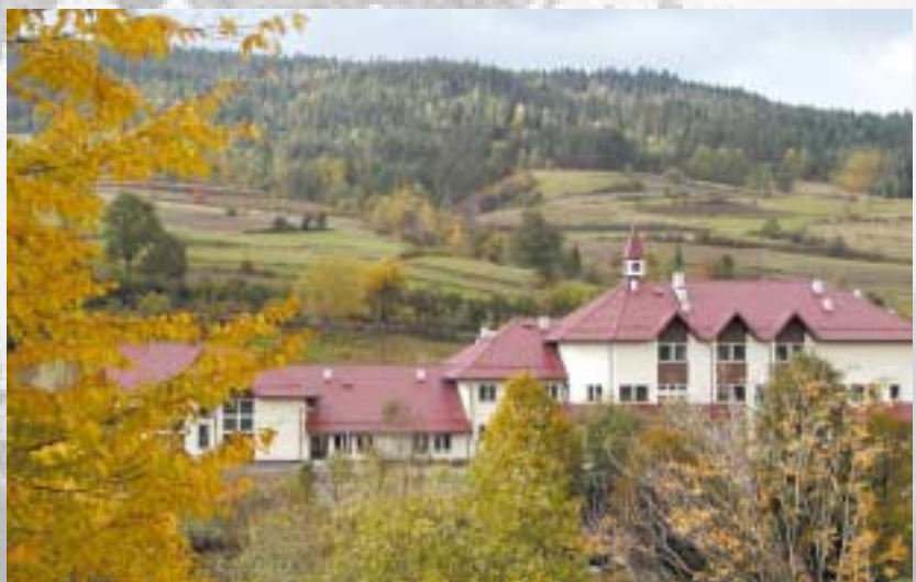
Zespół Szkoły Podstawowej i Przedszkola

Malownicze trasy o dużych walorach widokowych, ukazujące piękno krajobrazu Beskidu Wyspowego. W większości prowadzą zalesionymi obszarami (najwyższy szczyt widokowy 1171 m n.p.m.). Trasy wymagają od turysty dobrej kondycji fizycznej, ofiarując w zamian niezapomniane wrażenia i widoki na Gorce, Pieniny i Tatry.