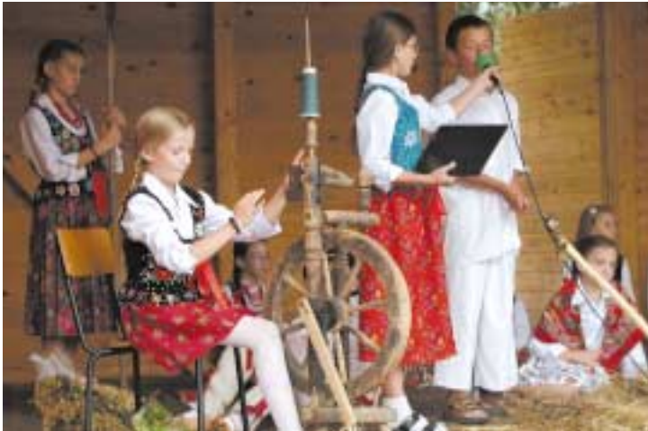
Występy okolicznościowe młodzieży