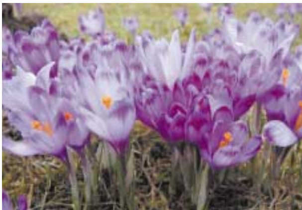
Krokus - pierwszy symbol wiosny

Klimat ma charakter górski. Wraz ze wzrostem wysokości n.p.m. spada temperatura, wzrasta ilość opadów, dłużej zalega pokrywa śnieżna.