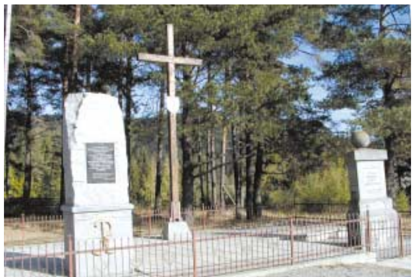
Pomnik na Przetęczy Rydza-Śmigłego