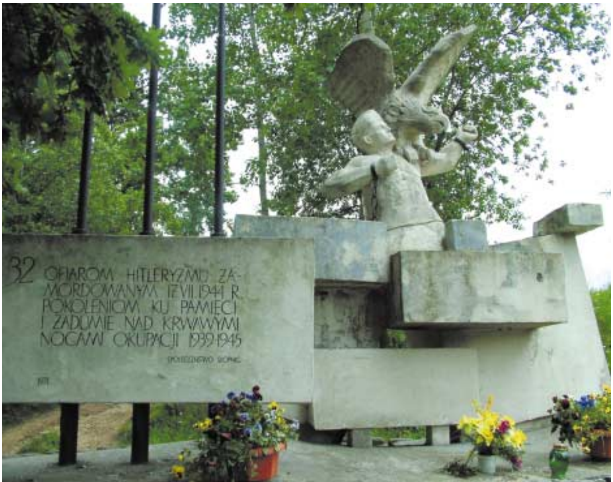
Pomnik ofiar hitleryzmu