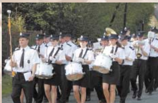
Orkiestra Dęta OSP w Słopnicach