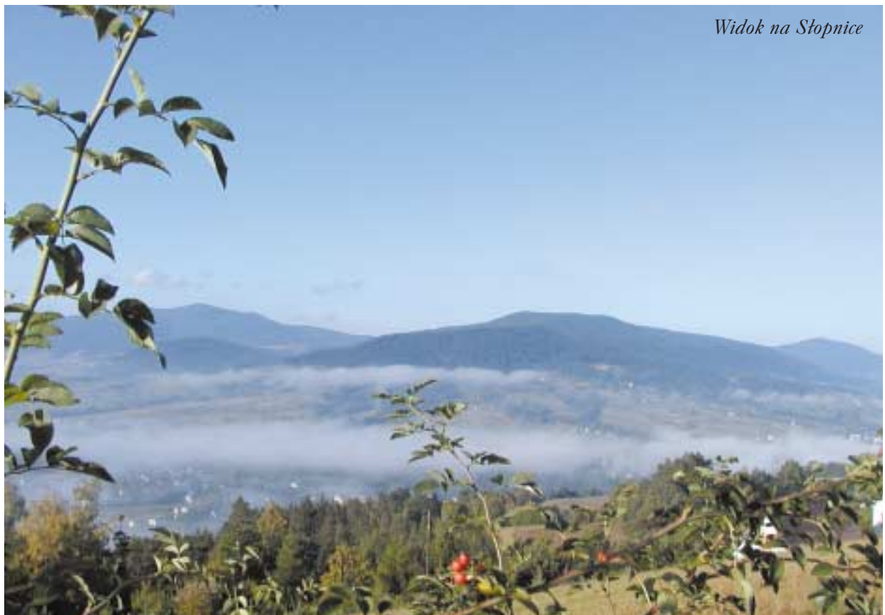
Widok na Słopnice