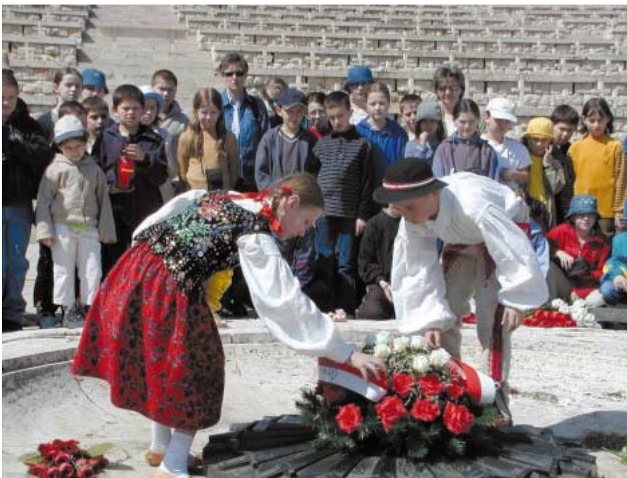
Monte Cassino – złożenie kwiatów