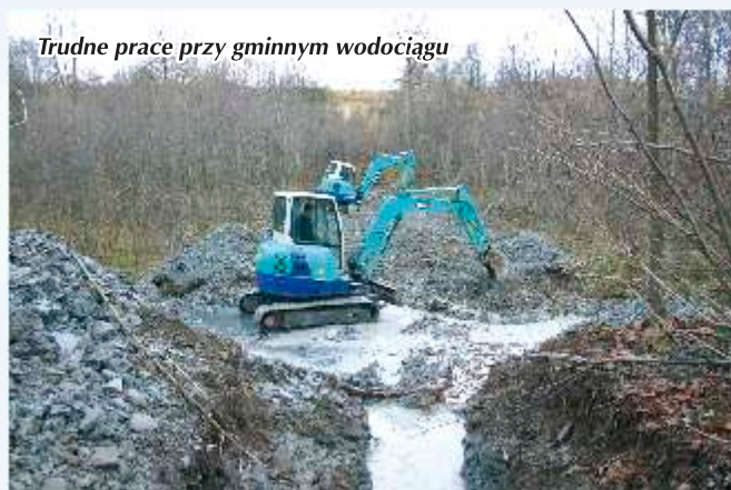
Trudne prace przy gminnym wodociągu

Priorytetowo traktowano również w 2008 r. dalszą budowę wodociągu gminnego. W ostatnim czasie obserwujemy nasilenie się okresów suchych,