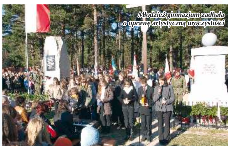
Młodzież gimnazjum zadbała o oprawę artystyczną uroczystości

Gimnazjaliści wraz z gronem pedagogicznym wzięli też udział w obchodach 90 rocznicy odzyskania przez Polskę niepodległości, które odbyły się na przełęczu Marszałka Edwarda Śmigłego - Rydza w Chyszówkach. Uroczystości patriotyczno - religijne ku czci walczących i poległych za ojczyznę rozpoczęły się o godzinie 11:30 od wspólnego śpiewania pieśni patriotycznych, ze specjalnie na tą okazję wydanej przez naszą szkołę śpiewnika "Ojczyzna ma". W samo południe została odśpiewany hymn narodowy i wciągnięto na maszt biało-czerwoną flagę. Wójt Gminy Słopnice powitał wszystkich przybyłych gości. Apel poległych przygotowała młodzież klasy o profilu wojskowym z Zespołu