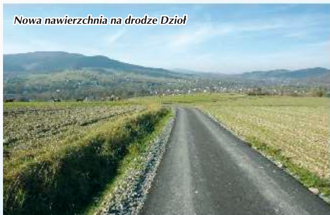
Nowa nawierzchnia na drodze Dzioł