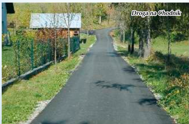
Droga na Chodnik

Dodatkowo wykonano bieżący remont dróg osiedlowych: Chochołówka II, Bieniówka, Kulpówka, Kulpowka-Garcarzówka, Za Miedzą, Sasy, Sołtyse, Góralówka, Miłkowskie, Folwark-Górny, Markowo, Międzydwory, Przystop, Giezmiki Górne, Piechoty, polegający na utwardzeniu, ofosowaniu, wykonaniu przepustów. Koszt ogólny tego zadania to 153 521 zł, a długość zmodernizowanych dróg to 2,8 km.