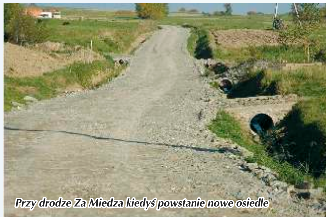
Przy drodze Za Miedza kiedyś powstanie nowe osiedle

Dodatkowo wykonano bieżący remont dróg osiedlowych: Chochołówka II, Bieniówka, Kulpówka, Kulpowka-Garcarzówka, Za Miedzą, Sasy, Sołtyse, Góralówka, Miłkowskie, Folwark-Górny, Markowo, Międzydwory, Przystop, Giezmiki Górne, Piechoty, polegający na utwardzeniu, ofosowaniu, wykonaniu przepustów. Koszt ogólny tego zadania to 153 521 zł, a długość zmodernizowanych dróg to 2,8 km.