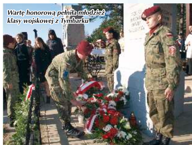
Wartę honorową pełniła młodzież klasy wojskowej z Tymbarku