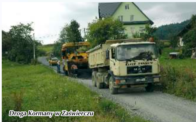
Droga Kormany w Zaświerczu

nawierzchnię asfaltową na drodze Granice-Markowo (od tzw. starej mleczarni do skrzyżowania na Granice). Ze względu na katastrofalny stan tej drogi, prócz nowej nawierzchni, wykonano w kilku miejscach korytowanie i wzmocniono podbudowę. Kolejną kluczową drogą była droga Zarąbki (od kościoła w Słopnicach Górnych do ostatniego przystanku koło tzw. Kuźni). Obie te inwestycje pochłonęły niemal całość środków przewidzianych początkowo na remonty dróg gminnych. Jednak w efekcie korzystnych zmian w budżecie udało się zabezpieczyć kolejne środki i wykonać jeszcze w 2008 roku całkiem sporo nowych dróg asfaltowych: Dylągówka, Na Chodnik, Kormany, Plebańskie I, Chochołówka, Szczęchy, Piechury, Dzioł, Góralówka, ChodnikII, Koprowina. Ogółem 2,4 km za kwotę 358 835 zł.