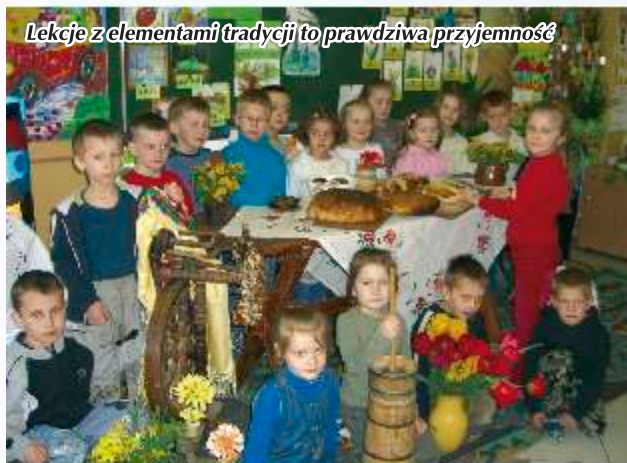
Lekcje z elementami tradycji to prawdziwa przyjemność

takich jak np. spotkania z historykami, wycieczki Szlakiem Architektury Drewnianej, śladami patrona szkoły, opracowanie drzew genealogicznych przodków, konkursy kolęd, konkursy literackie i krasomówcze. Zgromadzono również wiele zabytkowych fotografii, stworzono słownik archaizmów Słopnic oraz album przydrożnych kapliczek. Dużą popularnością cieszyły się zajęcia warsztatowe prowadzone przez Koło Gospodyń Wiejskich oraz spotkania zorganizowane w ramach poznawania ginących zawodów. Wszystkie prace wykonane przez uczniów w ramach programu "Bliższe ojczyzny - Małopolska" można obejrzeć na terenie szkół.