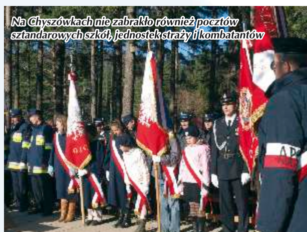
Na Chyszówkach nie zabrakło również pocztów sztandarowych szkół, jednostek straży i kombatantów