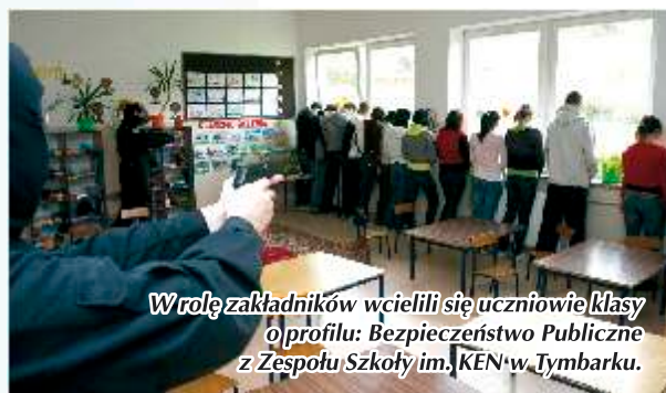
W rolę zakładników wcielili się uczniowie klasy o profilu: Bezpieczeństwo Publiczne z Zespołu Szkoły im. KEN w Tymbarku.

Zgodnie ze scenariuszem, terroryści wdarli się do szkoły w Słopnicach Górnych i biorąc zakładników, zażądali miliona euro okupu. Atak terrorystów i potencjalna możliwość zdetonowania ładunku wybuchowego ujęty w scenariuszu, zmusił kierujących sztabem kryzysowym stacjonującym w budynku urzędu gminy do zaangażowania grupy policyjnych antyterrorystów,