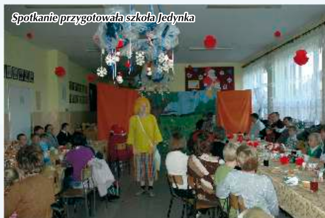
Spotkanie przygotowała szkoła Jedynka

Tegoroczne mikołajki dla dzieci niepełnosprawnych, zorganizowane przez Szkołę Podstawową Nr 1 i Gminny Ośrodek Pomocy Społecznej, odbyły się 2 grudnia br. Tym razem spotkanie odbyło się w szkole "Jedynce". Dzieci wspólnie z rodzicami i opiekunami, miały okazję obejrzeć inscenizację znanej bajki "O dwóch takich, co ukradli księżyc". Zabawny spektakl bardzo spodobał się widzom, którzy chętnie też uczestniczyli w zabawie z aktorami - Jackiem i Plackiem. Goście otrzymali niewielkie upominki, ale najbardziej przypadły im do gustu pluszowe maskotki zebrane przez dzieci