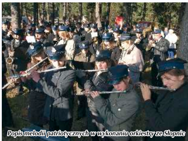
Popis melodii patriotycznych w wykonaniu orkiestry ze Słopnie