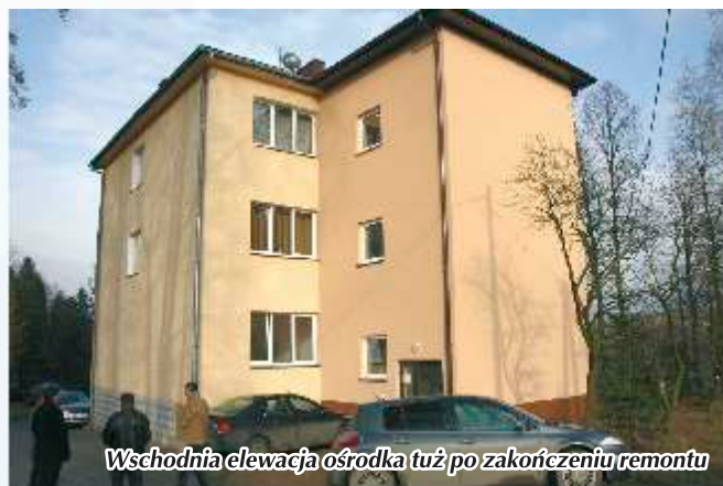
Wschodnia elewacja ośrodka tuż po zakończeniu remontu