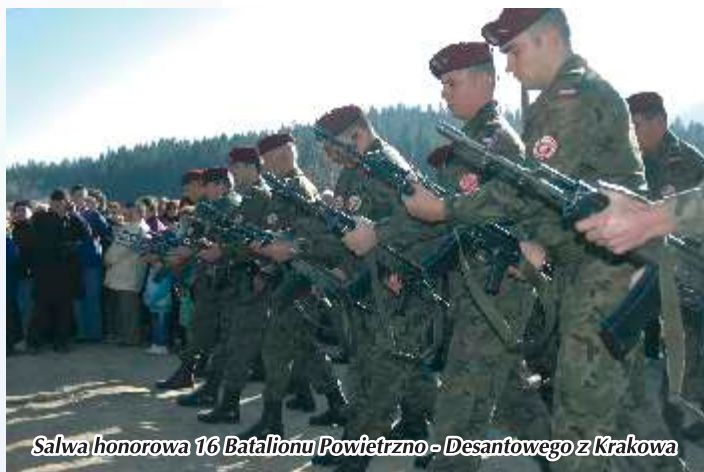
Salwa honorowa 16 Batalionu Powietrzno - Desantowego z Krakowa

Szkół im. KEN w Tymbarku, natomiast żołnierze kompanii honorowej 16. Batalionu Powietrzno - Desantowego z Krakowa oddali salwę honorową. Nasi uczniowie przedstawili słowno - muzyczną akademię, po której odbyła się msza św. odprawiona w intencji Ojczyzny. Obchody uświetniły także melodie patriotyczne wykonane przez orkiestry dęte z Dobrej i ze Słopnic.