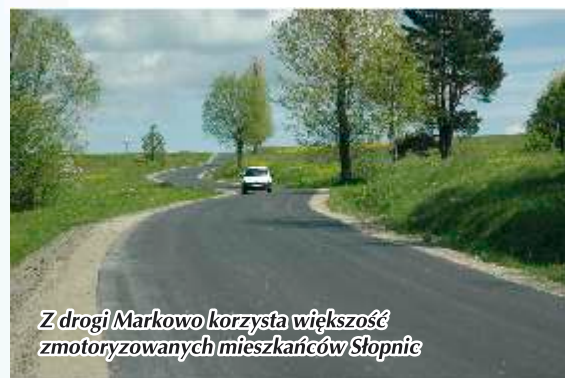
Z drogi Markowo korzysta większość zmotoryzowanych mieszkańców Słopnic

W tym roku udało się również wykonać sporo inwestycji na drogach gminnych. Już w maju wyremontowano dwa bardzo ważne odcinki dróg, mające kluczowe znaczenie dla komunikacji w naszej gminie. Położono nową