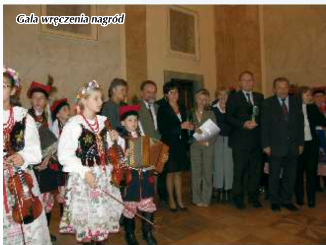
Gala wręczenia nagród