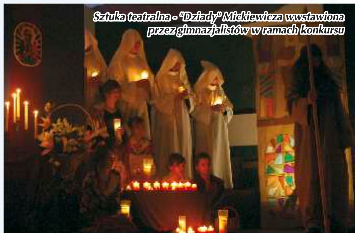
Sztuka teatralna - "Dziady" Mickiewicza wstawiona przez gimnazjalistów w ramach konkursu