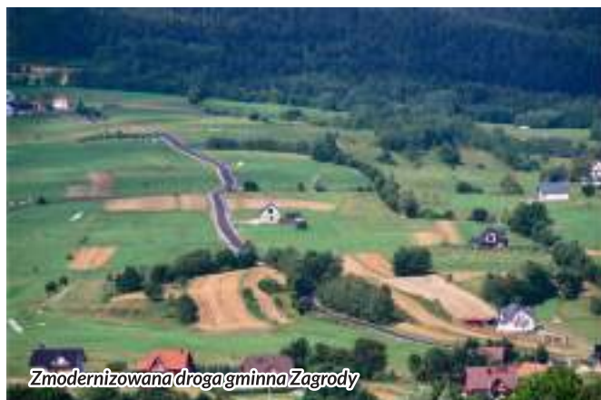
Zmodernizowana droga gminna Zagrody

Następną dużą tegoroczną inwestycją gminną jest "Przebudowa drogi gminnej Słopnice-Zagrody". Dzięki pozyskanym środkom z Funduszu Dróg Samorządowych oraz wystarczającą ilością terenu, istniejącą (wąską) drogę na długości 2080 mb poszerzono, doprowadzając do parametrów wymaganych dla drogi gminnej. Prace zostały ukończone w sierpniu br. Koszt realizacji wynosi 1 761 975 zł, uzyskana kwota dofinansowania to 1 218 402 zł.