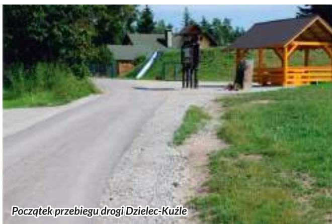
Początek przebiegu drogi Dzielec-Kuźle