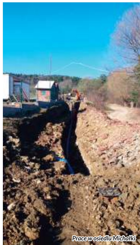
Prace w osiedlu Michałki

Zrealizowane w okresie ostatnich kilku lat duże inwestycje wodno-kanalizacyjne sprawiły, że obecnie Gmina Słopnice jest zwodociągowana w ok. 90% oraz skanalizowana w ponad 60%. Jest to jeden z najwyższych wskaźników w Powiecie Limanowskim.