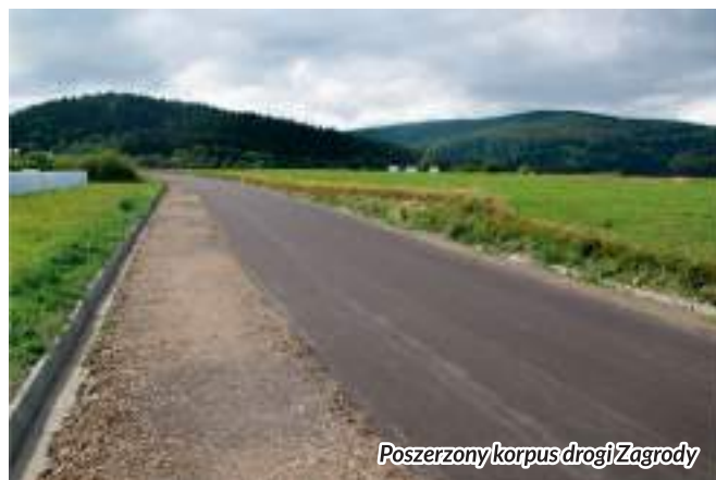
Poszerzony korpus drogi Zagrody

Kolejną dużą inwestycją drogową jest modernizacja trzech odcinków dróg, mająca głównie na celu wzbogacenie oferty turystycznej (turystyki rowerowej). W ramach modernizacji wykonano: nową