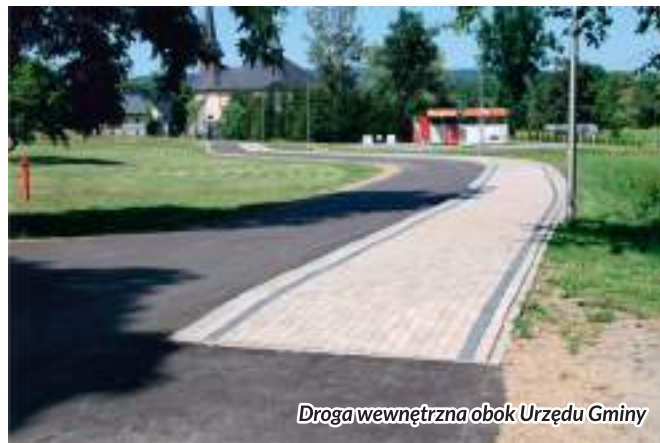
Droga wewnętrzna obok Urzędu Gminy

* dokończono budowę drogi wewnętrznej wraz z chodnikiem, która połączyła teren przy Urzędzie Gminy z Gminnym Centrum Rekreacji i dokończono ogrodzenie terenu rekreacyjnego. Wartość tej inwestycji to 218 749 zł.