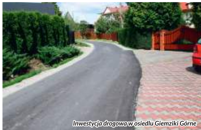
Inwestycja drogowa w osiedlu Gieźniki Górne

* wykonano nową nawierzchnię asfaltową na odcinku 400 mb w osiedlu Gieźniki Górne za kwotę 73 756 zł.