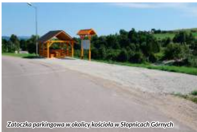
Zatoczka parkingowa w okolicy kościoła w Słopnicach Górnych

nawierzchnię asfaltową na drodze Granice (Leśniówka) na odcinku 985 mb, nową nawierzchnię asfaltową na drodze Dzielec na długości 755 mb oraz przywrócono do funkcjonowania malowniczo położoną drogę łączącą osiedle Dzielec z osiedlem Kuźle o długości 1670 mb. Zadanie to obejmowało również wykonanie dwóch niewielkich parkingów dla turystów z wiatami turystycznymi oraz tablicami informacyjnymi. Koszt tej inwestycji to 969 800 zł. Powyższe zadanie zrealizowane zostało jako część dużego projektu o nazwie "Rozbudowa szlaków wielofunkcyjnych wokół góry Mogielica i szlaków łącznikowych w gminach Limanowa, Słopnice, Kamienica, mieście Limanowa wraz z ich połączeniem z trasą główną VeloDunajec" współfinansowa-