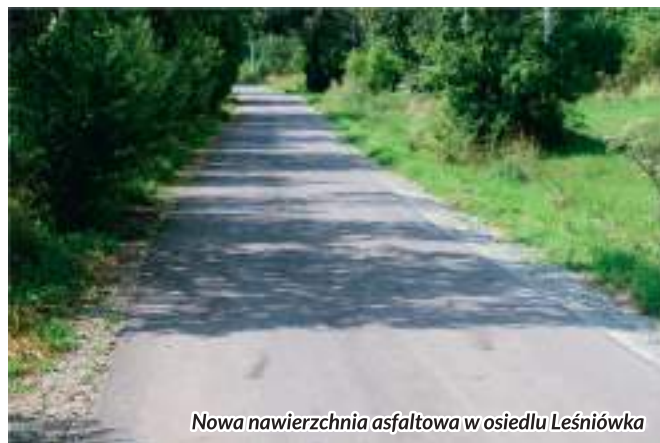
Nowa nawierzchnia asfaltowa w osiedlu Leśniówka

* wykonano nową nawierzchnię asfaltową na odcinku 300 mb drogi Leśniówka-Pokusówka za kwotę 65 790 zł.