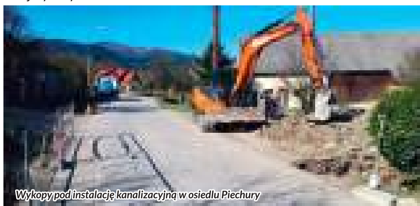
Wykopy pod instalację kanalizacyjną w osiedlu Piechury

Następną dużą tegoroczną inwestycją gminną jest "Przebudowa drogi gminnej Słopnice-Zagrody". Dzięki pozyskanym środkom z Funduszu Dróg Samorządowych oraz wystarczającą ilością terenu, istniejącą (wąską) drogę na długości 2080 mb poszerzono, doprowadzając do parametrów wymaganych dla drogi gminnej. Prace zostały ukończone w sierpniu br. Koszt realizacji wynosi 1 761 975 zł, uzyskana kwota dofinansowania to 1 218 402 zł.