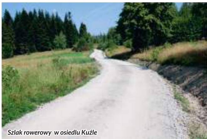
Szlak rowerowy w osiedlu Kuźle

nego ze środków Unii Europejskiej w ramach Regionalnego Programu Operacyjnego Województwa Małopolskiego 2014-2020. Kwota dofinansowania to 378 231,36 zł.